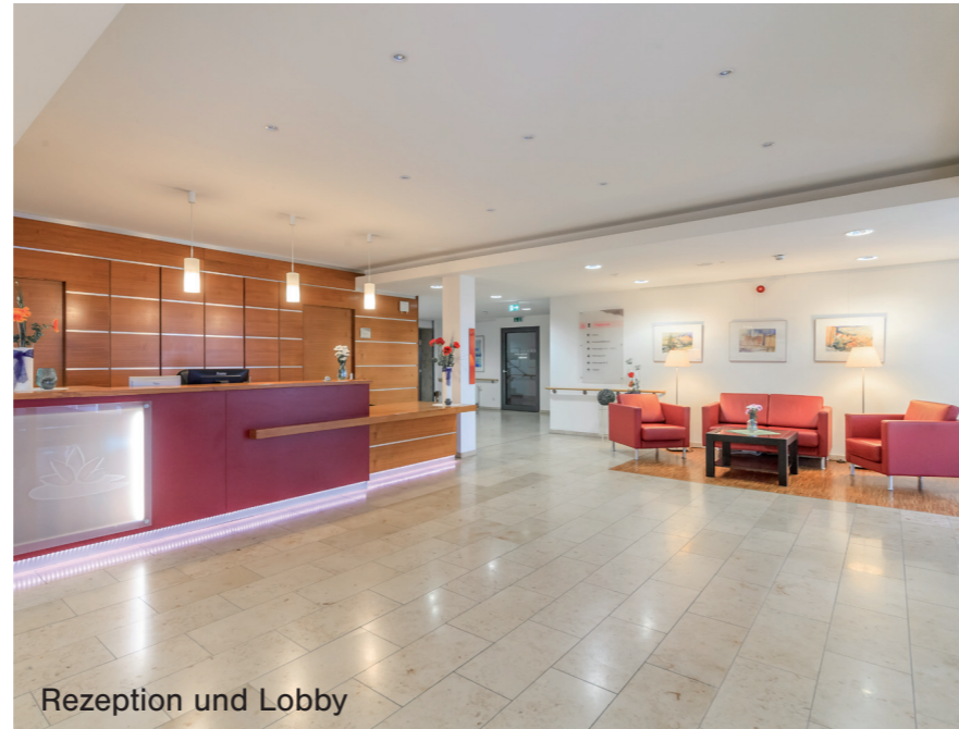
Rezeption und Lobby

Direkte Lage am Wöhrder See mit sämtlichen Einkaufsmöglichkeiten, Ärzten, Apotheken, Banken, Cafés, Restaurants sowie Straßenbahn und Buslinie in unmittelbarer Nachbarschaft.