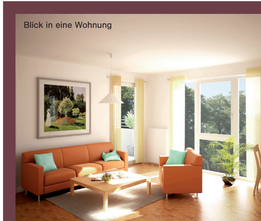
Blick in eine Wohnung